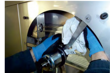
Czyszczenie silnika i komory wywiewnej filtra