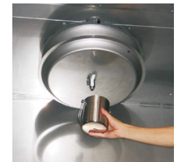
Opróżnianie tacy ociekowej filtra Turbo-Swing