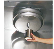
Opróżnianie tacy ociekowej filtra Turbo-Swing