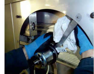
Czyszczenie silnika i komory wywiewnej filtra