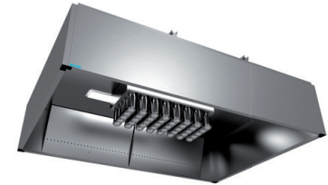
Okap wyciągowy typu JVI