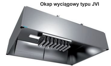
Filtr UV Combilux