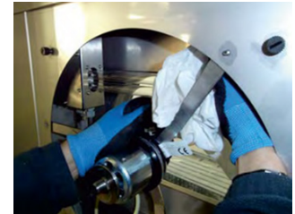
Czyszczenie silnika i komory wywiewnej filtra