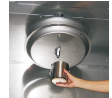
Opróżnianie tacy ociekowej filtra Turbo-Swing