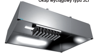
Okap wyciągowy typu JLI