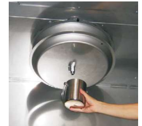
Opróżnianie tacy ociekowej filtra Turbo-Swing