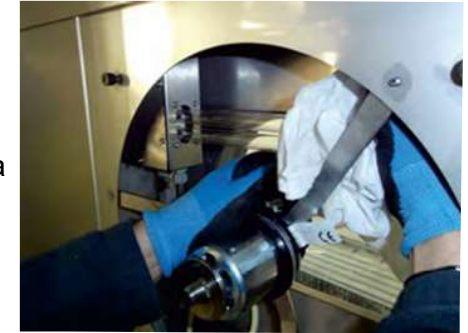
Czyszczenie silnika i komory wywiewnej filtra