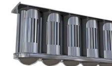
Kaseta filtra JCE z cylindrami i zbiornikami na tłuszcz