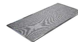
Filtr siatkowy FF