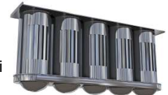
Kaseta filtra JCE z cylindrami i zbiornikami na tłuszcz