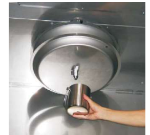
Opróżnianie tacy ociekowej filtra Turbo-Swing