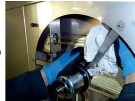
Czyszczenie silnika i komory wywiewnej filtra