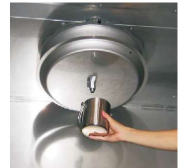
Opróżnianie tacy ociekowej filtra Turbo-Swing