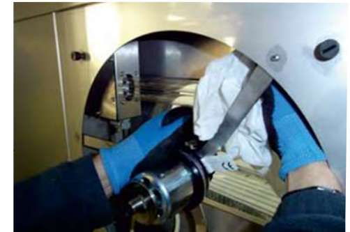
Czyszczenie silnika i komory wywiewnej filtra